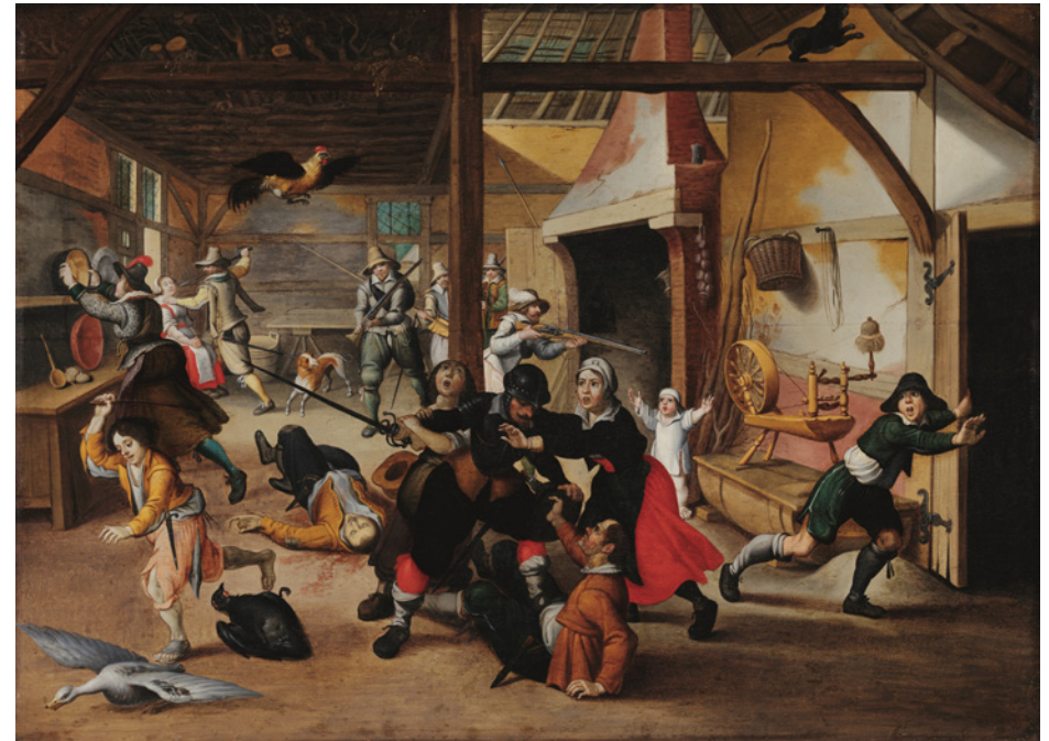
Dreißigjähriger Krieg: Soldaten plündern einen Bauernhof, ca. 1620 Sebastiaan Vranckx (1573–1647) Deutsches Historisches Museum, Berlin