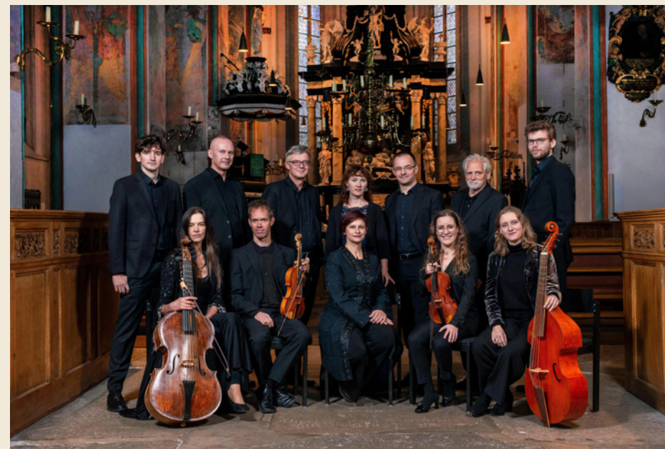
Europäisches Hanse-Ensemble 2025