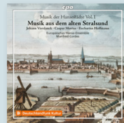
Musik der Hansestädte Vol. 1 Musik aus dem alten Stralsund cpo 555 578-2 Bestell-Nr: 11164033