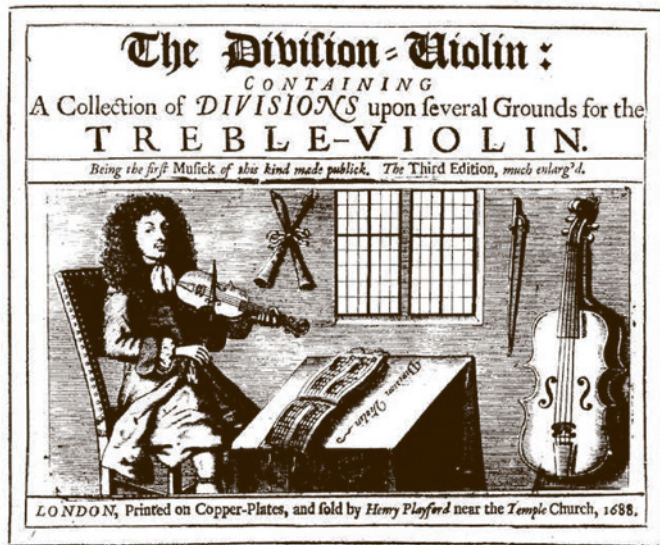
Playford's „Division Violin“ enthält Werke von T. Baltzar

Dominus“ fällt die ruhige Stimmführung bei „somnum“ (Schlaf) auf, die schnellen Koloraturen bei „sagittae“ (Pfeile) oder die vertrackte Rhythmik bei „confunden-tur“ (werden verwirrt).