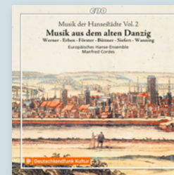
Musik der Hansestädte Vol. 2 Musik aus dem alten Danzig cpo 555 647-2 Bestell-Nr: 11576886