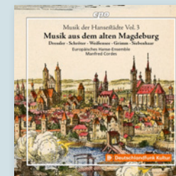
Musik der Hansestädte Vol. 3 Musik aus dem alten Magdeburg cpo 555 710-2 Bestell-Nr: 11895616