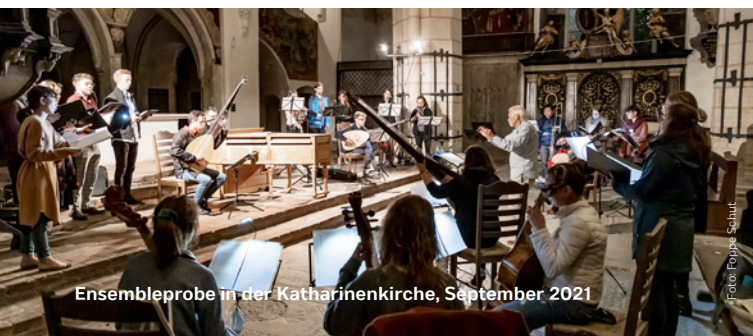
Ensembleprobe in der Katharinenkirche, September 2021

Das Europäische Hanse-Ensemble formiert sich jährlich neu und wird aus Musiker:innen gebildet, die sich in den Meisterkursen des Vorjahres besonders bewährt haben. Mit einem jeweils neu zu erarbeitenden Programm geht das Europäische Hanse-Ensemble auf Konzertreise durch verschiedene Hansestädte. Probenphase und Konzertreise finden im Sommer 2024 statt. Konkrete Termine werden gegen Ende des Jahres 2023 bekanntgegeben.